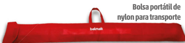
Bolsa portátil de nylon para transporte