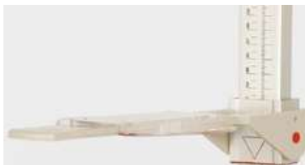
detalhe da régua

Infantômetro horizontal portátil para medir crianças, com paquímetros deslizadores