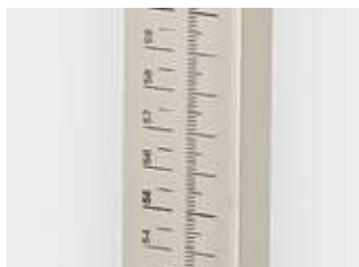
novo design da escala