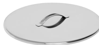
Tampa para Comadre