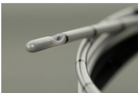
Ponta fechada com 01 furo lateral